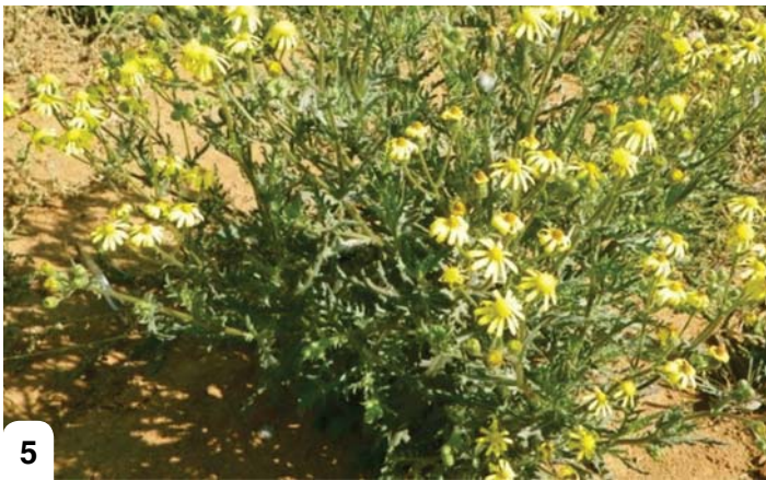
Peo e nyenyane ya semela sa ragwort.